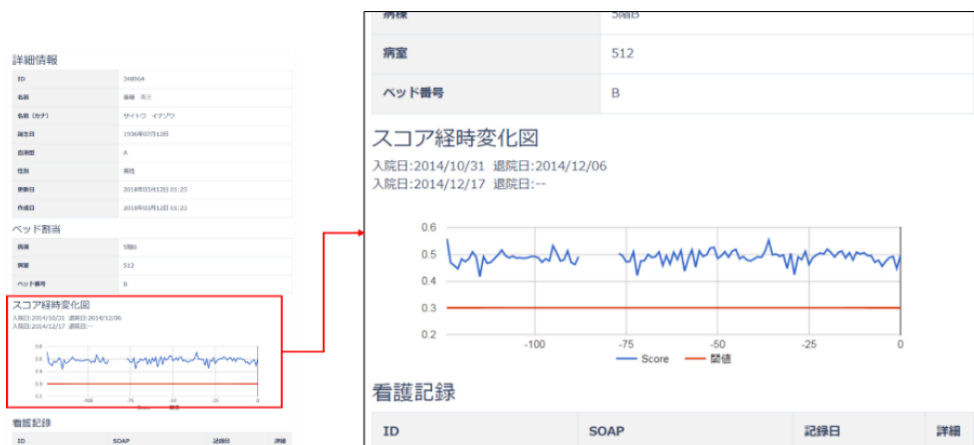
(図表②：実証実験版デモ画面より)

転倒転落リスクの高い患者のスコア表示画面。変化するリスクレベルを時間の推移とともに確認可能（イメージ）。